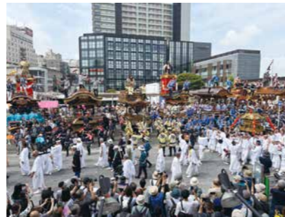
山車・屋台競演(総踊り)