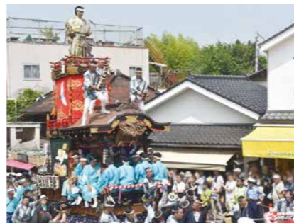
山車・屋台総引き