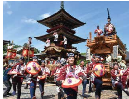
山車・屋台競演(総踊り)