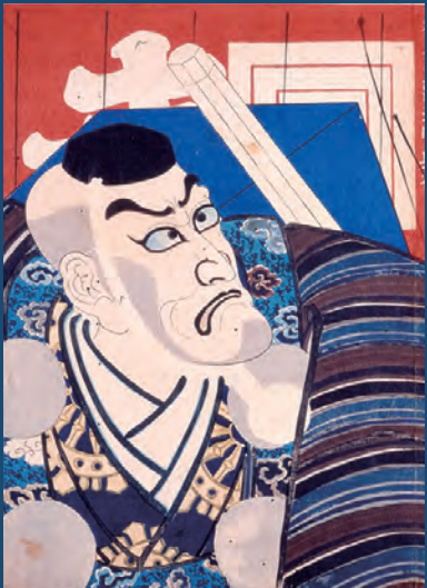
「간지초」무사시보네펜게를 연기하는 7대째 이치카와 단주로